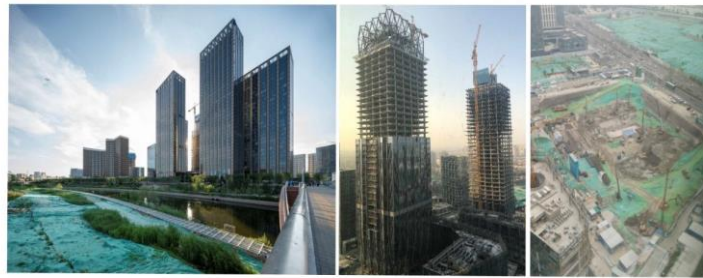
一期項目（公寓）已竣工

北京通州新光大中心總建築面積超過 70 萬平米，由光大控股牽頭出資，光大控股旗下光大安石負責建設及運營，總投資近 200 億元，一期項目（公寓）已經竣工，二期項目（辦公樓）已全部封頂，三期項目（辦公樓）已在樁基階段。未來將打造成北京城市副中心運河商務區的標杆項目，為符合北京城市副中心功能定位的企業總部入駐創造良好條件。