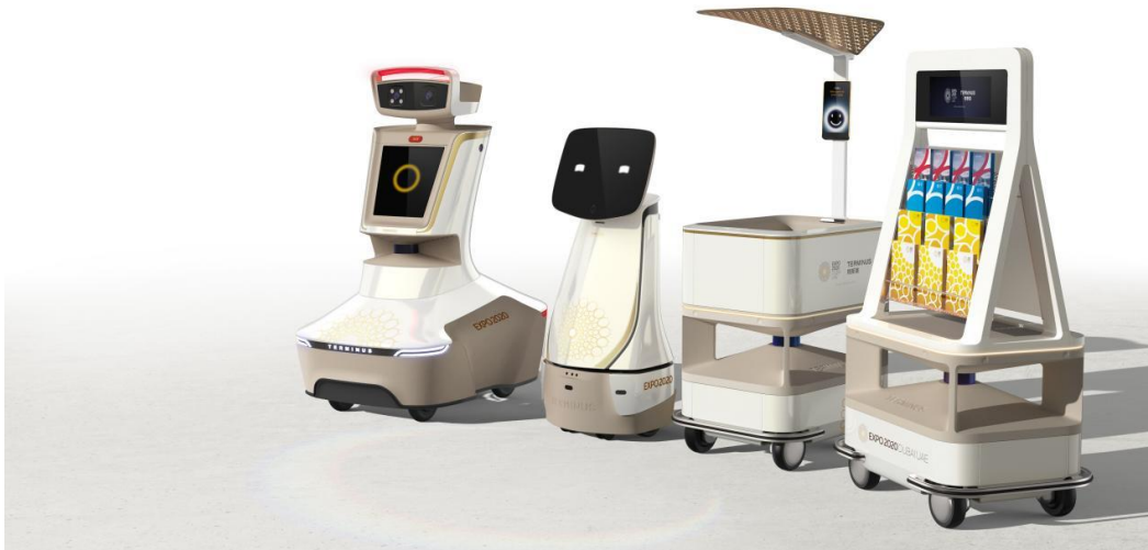
多款特斯聯智慧型機器人將為 2020 年迪拜世博會提供服務

在迪拜世博會正式召開期間，特斯聯將在會上部署超過 150 台智慧型機器人，並將和大會吉祥物機器人 Opti 一起與各國遊客展開互動，利用多模態交互、5G 无人驾驶、AI 建圖和物體探測等技術 多样化功能 ， 为展会 提供訪客迎接與 游客 互動、信息問訊、 安保巡邏 、 餐飲 飲食配送等服務。