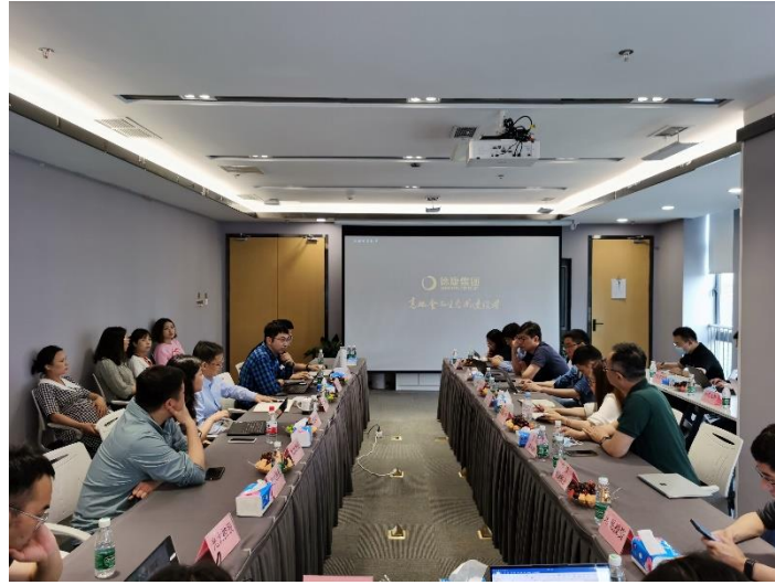
考察團走訪德康農牧

德康農牧是夾層基金二期和三期連續投資企業，業績表現優異。該公司創立於2006年，主營業務為生豬養殖，輔以優質肉雞養殖。經過多年積累和基金的投資助力，德康農牧的業務於近年實現了爆發式發展，生豬出欄量從2015年的十萬頭級別快速增長，至2018年德康農牧出欄量已達百萬頭級別，在全行業受到重大疫情影響下，德康農牧在2019、2020年的出欄量仍然保持了較行業內公司更高的增長，而且儲備產能充足、養殖效率不斷提升，已經成為西南地區綜合成本最低、規模最大和發展最快的養殖企業之一。